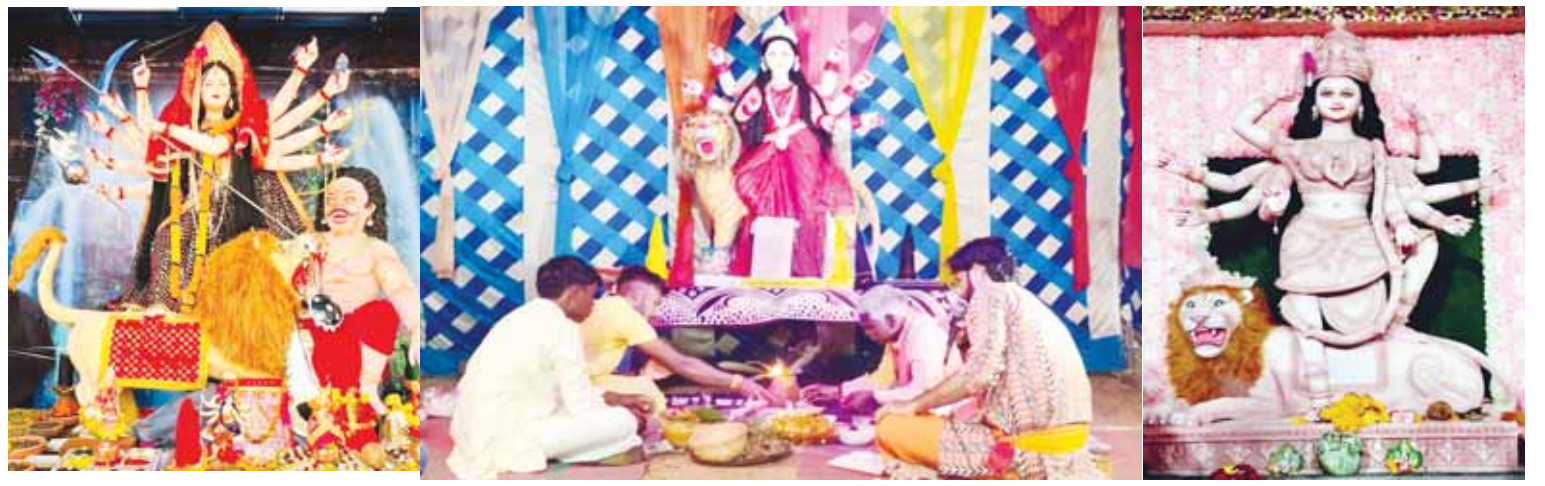
श्रीराम जानकी हनुमान मंदिर, रोशननगर।