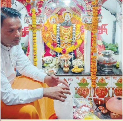
बरगवां स्थित श्री भूमि प्रकट मां शारदा माता मंदिर बरगवां कटनी मी माता की महाअरती व छप्पन भोग का आयोजन किया गया इस दौरान काफी संख्या में श्रद्धालुओं की मौजूदगी रही

कई स्थानों पर विराजीं दुर्गा प्रतिमाएं, सजावट से गली मोहल्ले तक रौनक, रामलीलाओं में उमड़ रही भीड़