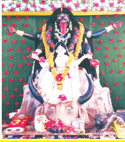
काली माता मंदिर दुर्गा उत्सव समिति, प्रेम नगर।