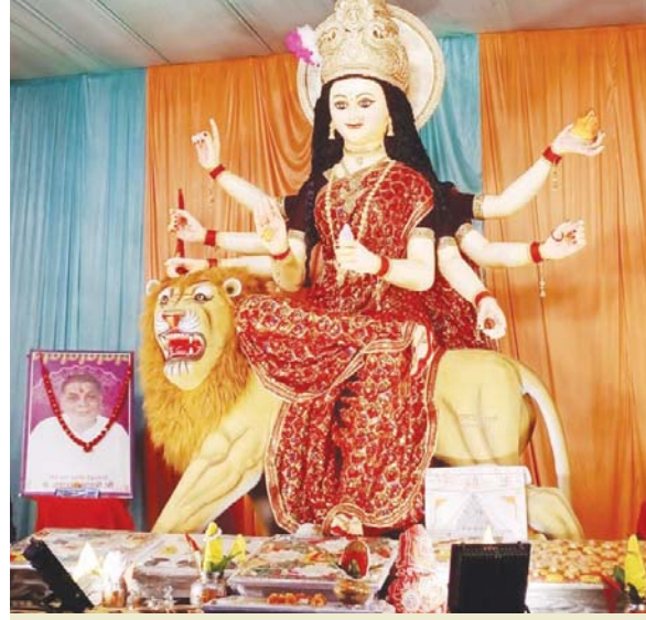
श्री श्री 1008 दुर्गा पूजा उत्सव समिति गायत्री नगर