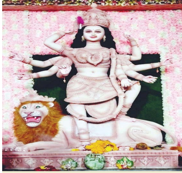
नवयुवक माँ दुर्गा उत्सव समिति, शिवमंदिर, एसकेपी कॉलोनी