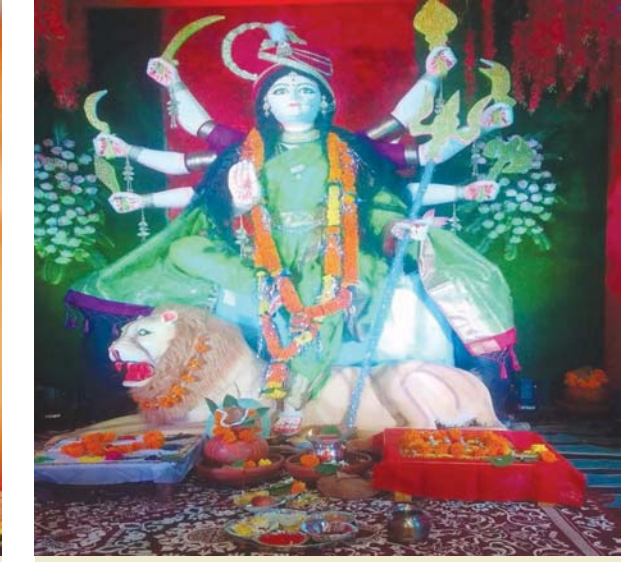
राजीव गांधी वार्ड क्रमांक 14 में निगम किराना रोड