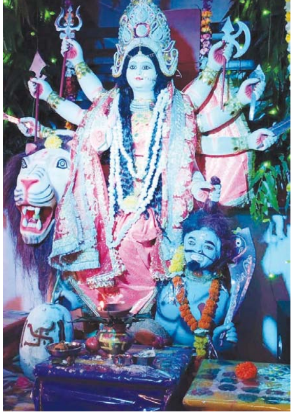
उपनगरीय क्षेत्र छपरवाह में नवरात्र पर्व धूमधाम से मनाया जा रहा है। यहां बस्ती के अंदर मांगत जननी की आकर्षक व मनोहारी प्रतिमा स्थापित कर क्षेत्र के लोग माता की भक्ति में लीन हैं।

मौत के बाद बच्चों को जगाया, अस्पताल शव पहुंचाया