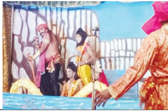
श्री श्री 1008 दुर्गा पूजा उत्सव समिति गायत्री नगर