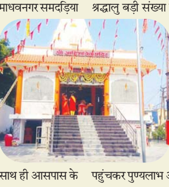
पहुंचकर पुण्यलाभ अर्जित करने का आग्रह किया है।

कटनी, यशभारत। उपनगरीय क्षेत्र माधवपुर समदड़िया सिटी स्थित श्री आदिशक्ति मंदिर में शारदेय नवरात्र के पावन पर्व के अवसर पर प्रतिवर्षानुसार इस वर्ष भी विभिन्न धार्मिक कार्यक्रमों का आयोजन किया गया है। यहां 28 सितंबर को बैठकी के दिन जवावे बोक व कलश स्थापना करते हुए मां दुर्गा की विशेष पूजा अर्चना की गई। यहां प्रतिदिन सुबह शाम पूजा अर्चना के साथ ही आरती की जा रही है। जिसमें कॉलोनी के लोगों के साथ ही आसपास के