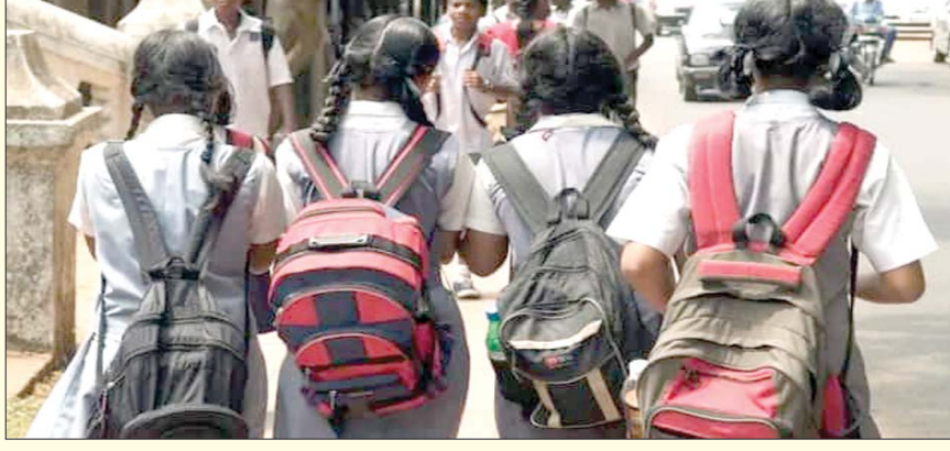
इस टीम में कुल 4 सदस्य शामिल होंगे, जो 1 दिन में 3 स्कूलों का औचक निरीक्षण करेंगे। राष्ट्रीय शिक्षा नीति के

भोपाल, यशभारत। राजधानी भोपाल में स्कूल शिक्षा विभाग ने स्कूलों के प्रति कड़ा कदम उठाया है। बच्चों जो बैग स्कूल को लेकर जाते हैं उनके बोझ को कम करने के लिए पहले ही निर्देश जारी कर दिए गए थे। लेकिन देखा जा रहा है कि अभी भी कई स्कूल ऐसे हैं जहां बच्चे भारी भरकम बैग लेकर स्कूल जा रहे हैं। दरअसल कई शिकायतों के दर्ज होने के बाद इसे लेकर अब विभाग सख्त कार्रवाई करने जा रहा है। मिली जानकारी के अनुसार 1 अक्टूबर से विभाग एक अभियान शुरू करने जा रहा है। जिसके तहत निर्धारित वजन से ज्यादा बैग का वजन मिलने पर स्कूल को भारी भरकम जुर्माना भरना पड़ेगा। भोपाल के किसी भी सरकारी या गैर सरकारी स्कूल में अब 1 अक्टूबर से बस्तों के वजन तौलें जाएंगे। बताया जा रहा है कि यह काम स्कूल शिक्षा विभाग और बाल संरक्षण आयोग के सदस्य मिलकर करेंगे।