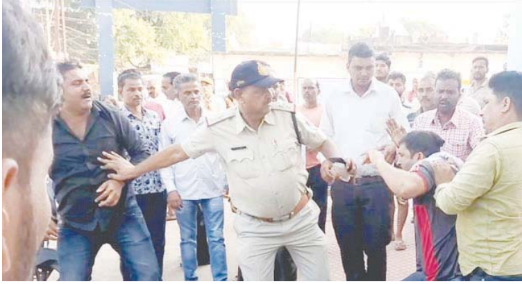
बरही अस्पताल में आरोपी फौजी से मारपीट करते मायके पक्ष के लोग।