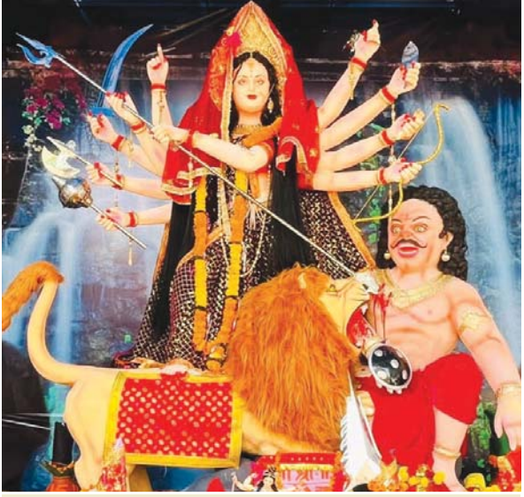
श्रीराम जानकी हनुमान मंदिर रोशन नगर की सुंदर प्रतिमा