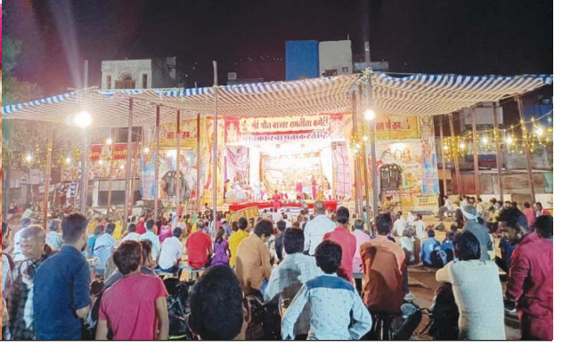
राजीव गांधी वार्ड क्रमांक 14 में निगम किराना रोड