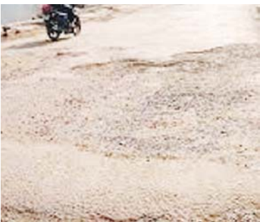
व्यवस्था को तुरंत दुरुस्त कराने की जरूरत है। यहां हाल चाका बायपास कुटला मार्ग का भी है।