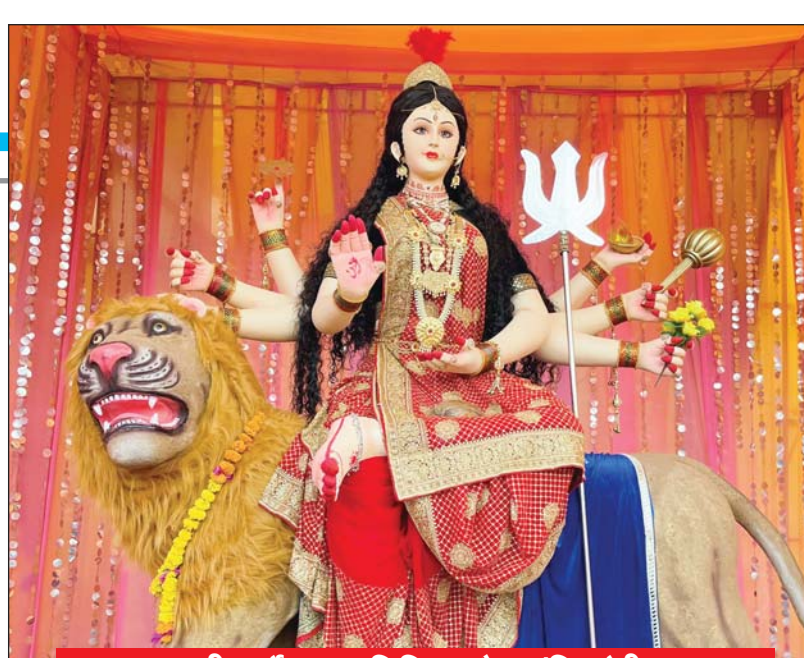
जाबाली दुर्गात्सव समिति हरदौल मंदिर चेरीताल