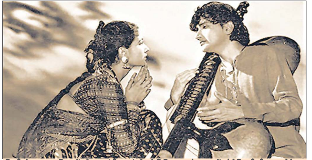
किसी से पूछा जाए कि उन्हें कौनसा संगीत पसंद है, तो निश्चित रूप से जवाब में कोई फिल्मी गीत सुनाई देगा! वास्तव में यह जवाब गलत नहीं है, क्योंकि यही फिल्म संगीत की लोकप्रियता का पैमाना भी है। संगीत को आज फिल्मी गीतों का पूरक मान लिया गया। फिल्मी गीत लोगों के दिलो-दिमाग में इस तरह रच-बस गए कि उन्हें ही असली संगीत समझा जाने लगा! जबकि, हमारे देश में शास्त्रीय संगीत को बहुत ऊंचा दर्जा मिला है।

'बैजू बावरा' के साथ संगीतकार नौशाद ने हिंदी फिल्म गीतों में शास्त्रीय संगीत का एक नया रूप पेश किया था। शास्त्रीय संगीत से सजी 1952 में आई इस फिल्म की सफलता में संगीत का बड़ा हाथ था। तब नौशाद 'रतन', 'अनमोल', 'शाहजहां' और 'मदर इंडिया' जैसी फिल्मों में संगीत के कारण पहचाने जाने लगे थे। 'बैजू बावरा' के गीतकार शकील बदायुनी भी नौशाद की खोज थे, लेकिन, इस फिल्म के लिए उन्हें उर्दू छोड़नी पड़ी और शुद्ध हिंदी में गीत लिखे। गीतों के साथ भजन 'मन लड़पत हरि दर्शन को आज' भी संगीतबद्ध किया गया था। नौशाद ने 'बैजू बावरा' के लिए डीवी पलुकर व उस्ताद अमीर खां की आवाज का भी इस्तेमाल किया था। नौशाद ने शास्त्रीय रागों का इस्तेमाल कर कई अच्छे फिल्मी गीत रचे। 1972 में