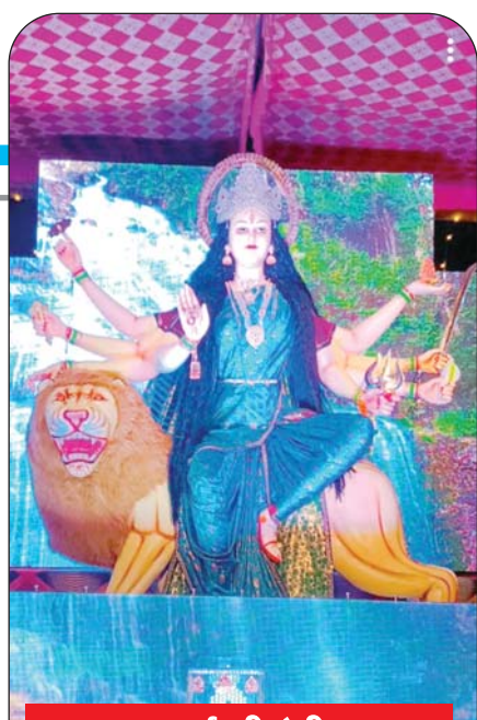
मढ़ई की देवी