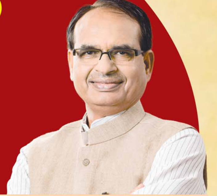
शिवराज सिंह चौहान, मुख्यमंत्री