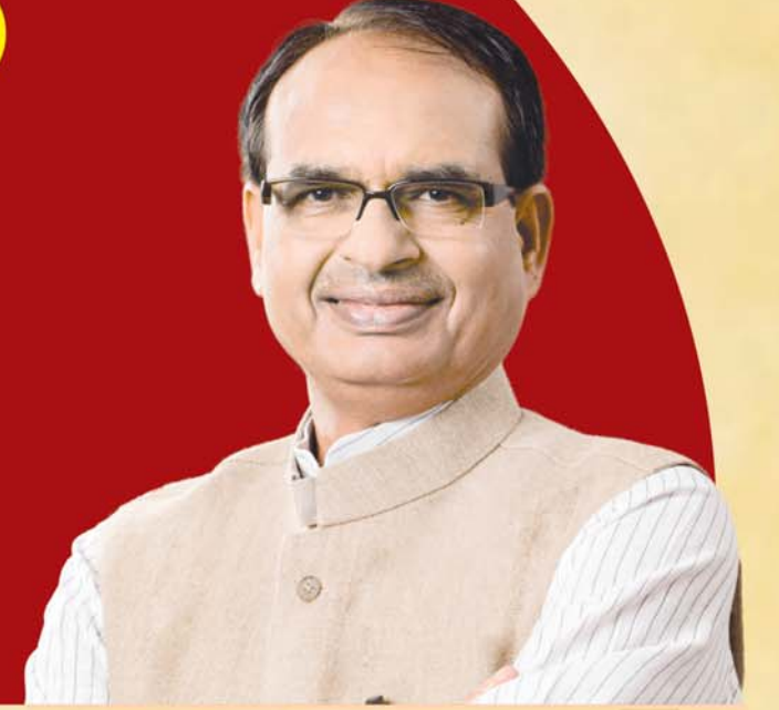
शिवराज सिंह चौहान, मुख्यमंत्री