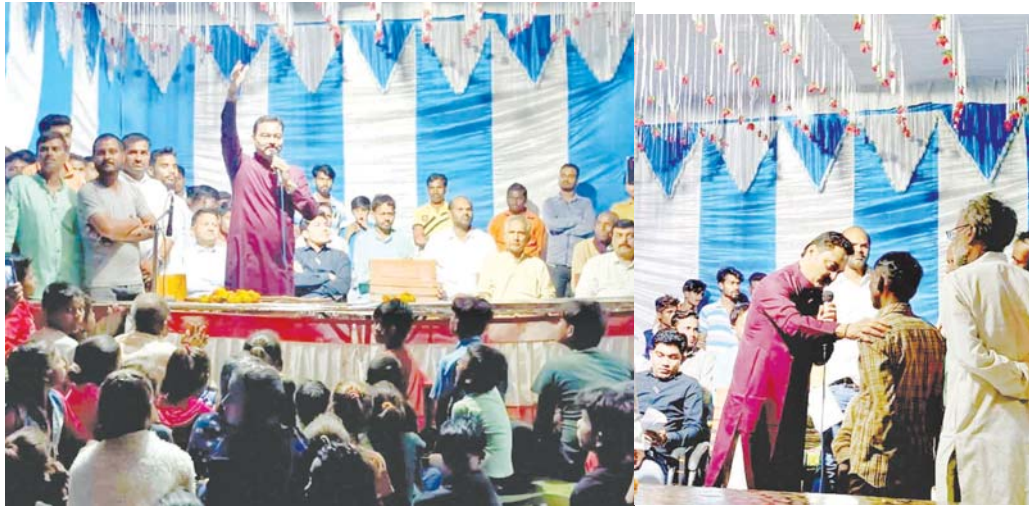
हितग्राहियों तक योजनाओं का लाभ पहुंचाना सरकार का संकल्प

विजयराघवगढ़, यशभारत। विजयराघवगढ़ क्षेत्र के विधायक संजय सत्येंद्र पाठक गत दिवस मुख्यमंत्री जनसेवा अभियान के तहत आयोजित हो रहे शिविरों की वास्तविकता जानने विधानसभा क्षेत्र के अंतिम छोर पर बसे ग्राम सुरमा पहुंचे। उन्होंने शिविर में आये ग्रामीणों से बातचीत कर उनकी समस्याएं जानी और मौके पर मौजूद अधिकारियों को शीघ्र समस्याओं के संतोषप्रद निराकरण के निर्देश दिये। ग्रामीणों ने कुछ अधिकारियों, कर्मचारियों के रवैये की शिकायत भी विधायक श्री पाठक से की। विधायक ने तत्काल सम्बन्धित विभाग के वरिष्ठ अधिकारियों से सम्पर्क कर लापरवाह अधिकारियों, कर्मचारियों पर कार्रवाई किये जाने की बात कही।