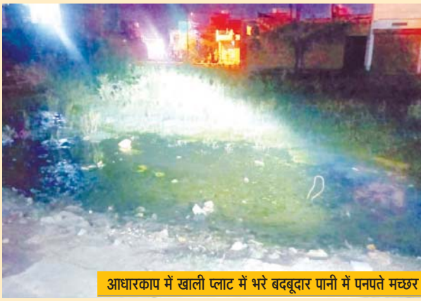
आधारकाप में खाली प्लांट में भरे बदबूदार पानी में पनप रहे मच्छर।

आधारकाप के नागरिकों ने बताया कि यहां नियमित रूप से साफ सफाई के अभाव में मच्छरजनित बीमारियों का प्रकोप लगातार बढ़ रहा है। नालियों की सफाई नहीं होने से नालियां चोक हो गई हैं। इसमें मलमा जमा हुआ है, इसके अलावा यहां कई खाली प्लांटों में बरसाती पानी भरा हुआ है। बरसाती पानी की वजह से प्लांटों में न केवल गंदगी है, बल्कि मच्छर पनप रहे हैं। यही कारण है कि पूरे आधारकाप क्षेत्र में मच्छरों के प्रकोप के चलते डेंगू और मलेरिया पीड़ित मरीजों की संख्या बढ़ रही है। नगर निगम प्रशासन द्वारा बरसात के मौसम में हर साल खाली प्लांटों में पानी भरने पर कार्रवाई की बात कही जाती है, लेकिन जब कार्रवाई की बात आती है तो कर्मचारी अपनी जेबें भरते हुए नजर आते हैं।