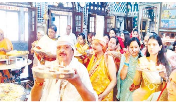
निर्वाण लाडू चढ़ाकर पुण्यलाभ अर्जित किया श्रद्धालुओं ने

कटनी, यशभारत। नगर के सभी जैन मंदिरों में 24वे तीर्थंकर भगवान महावीर निर्वाण महोत्सव अपार उत्साह एवं हर्षोल्लास के साथ मनाया गया। इस अवसर पर धर्मानुरागी बंधुओं, माताओं, बहनों ने निर्वाण लाडू चढ़ाकर पुण्यलाभ अर्जित किया। इस अवसर पर श्री 1008 पार्श्वनाथ दिगम्बर जैन बड़ा मंदिर, श्री 1008 शांतिनाथ दिगम्बर जैन मंदिर रंगटा कालोनी, श्री 1008 पार्श्वनाथ दिगम्बर जैन कांच मंदिर, श्री 1008 चंद्रप्रभु दिगम्बर जैन सिंघई मंदिर, श्री 1008 मुनिमुसुन्न दिगम्बर जैन मंदिर, श्री 1008 पार्श्वनाथ दिगम्बर जैन मंदिर हाऊसिंग बोर्ड कालोनी, श्री 1008 चंद्रप्रभु दिगम्बर जैन चौधरी