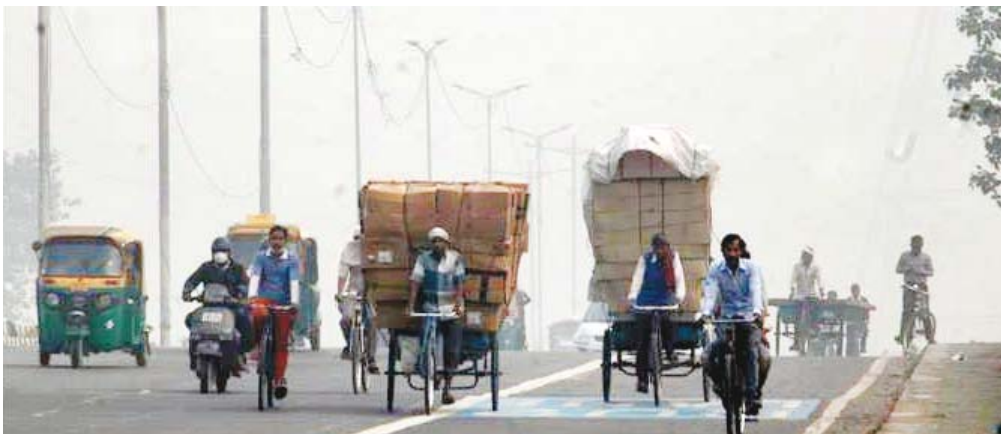
चार प्रमुख शहरों के हाल भी कोई अच्छे नहीं रहे। प्रदेश का सबसे प्रदूषित शहर उज्जैन था। यहां एक्यूआई का स्तर 267 था। जबलपुर, इंदौर, ग्वालियर और भोपाल में भी हवा का स्तर पूरे कैटेगरी पर पहुंचा। एक्यूआई का स्तर भोपाल में 255, ग्वालियर में 231, जबलपुर में 225, इंदौर में 210, कटनी में 224 तथा रतलाम में 236 रिकॉर्ड किया गया।

कटनी, यशभारत। कटनी में भले ही पटाखों पर प्रतिबंध रहा हो लेकिन कटनी में जमकर पटाखे फूटे परिणाम था कि कटनी की आवाहवा दिवाली स अब तक नहीं सुधर सकी है। भोपाल, ग्वालियर, जबलपुर के बाद इंदौर कटनी दिवाली पर जमकर पटाखे फोड़े गए। नतीजतन मग्न की फिजा खराब हो गई। सबसे ज्यादा प्रदूषित उज्जैन हो गया, जहां एयर क्वालिटी 267 तक पहुंच गई। वहीं जबलपुर, इंदौर, ग्वालियर व भोपाल में भी हवा का स्तर कमजोर कैटेगरी पर पहुंचा। एक्यूआई का स्तर भोपाल में 255, ग्वालियर में 231, जबलपुर में 225, इंदौर में 210, कटनी में 224 व रतलाम में 236 रिकॉर्ड किया गया। एनजीटी की कड़ाई के बावजूद मध्य प्रदेश में पटाखों को छोड़ने के लिए तय नियमों पालन नहीं हुआ। प्रदेश में वायु प्रदूषण अपने तय मानक से अधिक दर्ज किया गया। दीपावली के बाद मध्य प्रदेश प्रदूषण नियंत्रण मंडल में दर्ज हुआ एक्यूआई यानी एयर क्वालिटी इंडेक्स का स्तर बिगड़ा पाया गया। मध्य प्रदेश के अलग-अलग शहरों के सामने आए आंकड़ों में सबसे ज्यादा प्रदूषित उज्जैन शहर दर्ज किया गया, जहां एयर क्वालिटी का स्तर 267 तक पहुंच गया। इतना ही नहीं मध्य प्रदेश के