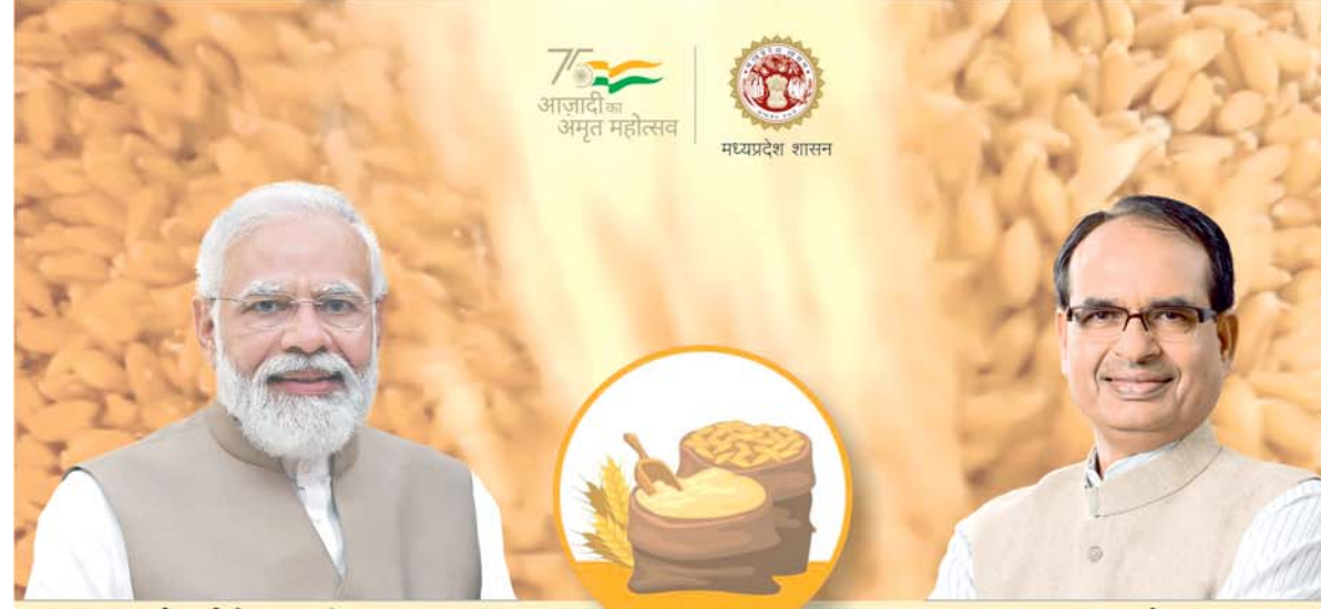
नरेन्द्र मोदी, प्रधानमंत्री | शिवराज सिंह चौहान, मुख्यमंत्री

कोच से उतरकर ट्रेक पर आए यात्री पहिए से धुआं उठता देख ट्रेन में सवार यात्रियों में हड़कंप मच गया। एसी कोच के कई यात्री बाहर निकल आए और ट्रेन के पहियों से धुआं निकलने की जानकारी जुटाने लगे। यात्रियों में कुछ समय के लिए दहशत फैल गई थी।