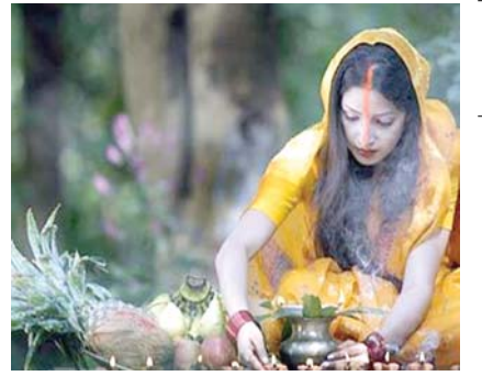
नहाय खाय के साथ छठ पूजा शुरू

● वर्ष-16 अंक 262 ● कटनी ● शुक्रवार, 28 अक्टूबर, 2022 ● मूल्य- 2 रुपए ● पृष्ठ-8 ● कार्तिक मास शुक्ल पक्ष-4 ● विक्रम संवत् 2079 शके 1935