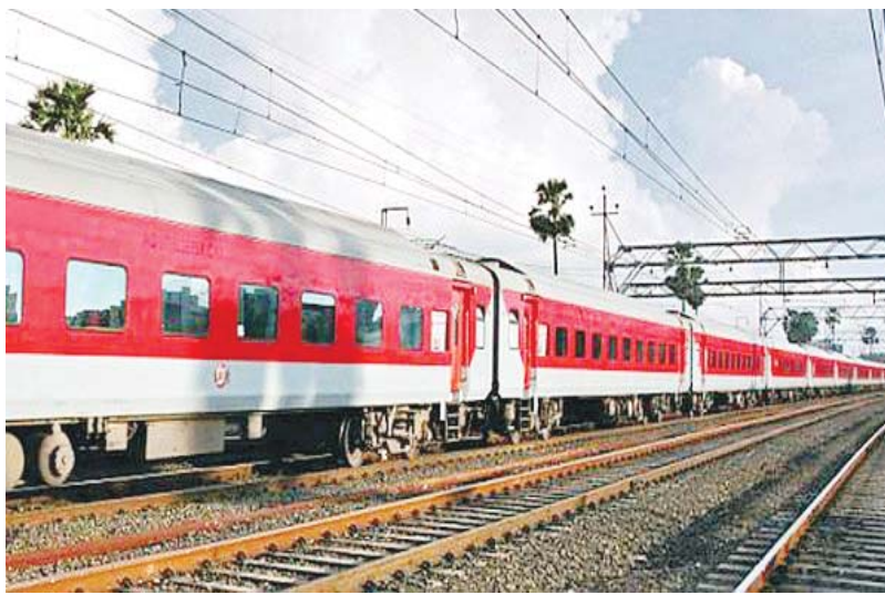
स्टेशन पहुंचेगी यह गाड़ी रास्ते में दोनों दिशाओं में यानी आने और जाने में खण्डवा, इटारसी, पिपरिया, जबलपुर, कटनी, सतना स्टेशनों पर रुकेगी। इस गाड़ी में 2 वातानुकूलित द्वितीय श्रेणी, 4 वातानुकूलित तृतीय श्रेणी, 10 शयनयान श्रेणी, 4 सामान्य श्रेणी, 1 जनरेटर कार एवं 1 एएसएलआरडी सहित कुल 22 कोच हैं

कटनी, यशभारत। जब छठ पूजा का महापर्व आता है तो सरकारें ट्रेनों में भीड़ को देखते हुए बिहार की ओर जाने वाली ट्रेनों की संख्या बढ़ा देती हैं ताकि लोग आसानी से इस पर्व को अपने घर पहुंचकर मना सकें। इस महापर्व पर अगर आप मध्य प्रदेश के जबलपुर से अपने घर लौटना चाहते हैं, तो यह आपके काम की खबर है सिर्फ स्पेशल ट्रेनें ही नहीं बल्कि 2 अनारक्षित स्पेशल ट्रेन भी 26 अक्टूबर से शुरू हो गई हैं। इन ट्रेनों की यात्रा इस प्रकार रहेगी। सीएसएमटी-दानापुर-सीएसएमटी ट्रेन की दो-दो ट्रिप तो पुणे-दानापुर-पुणे ट्रेन की एक-एक ट्रिप होगी। ये ट्रेनें इटारसी, जबलपुर से होते हुए दानापुर जाएंगी। गाड़ी संख्या 01411 सीएसएमटी-दानापुर-स्पेशल ट्रेन 26 और 29 अक्टूबर को छत्रपति शिवाजी महाराज टर्मिनस से 11:55 बजे खाना होगी। यह अगले दिन मध्यरात्रि के बाद 00:20 बजे इटारसी, 04:30 बजे जबलपुर, 8:25 सतना और 17 बजे दानापुर स्टेशन पहुंचेगी