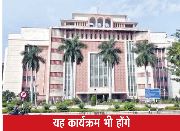
यह कार्यक्रम भी होंगे

भोपाल, यशभारत। मध्य प्रदेश के 67वें स्थापना दिवस पर 1 नवंबर से 7 नवंबर तक अनेक सांस्कृतिक कार्यक्रम होंगे। प्रदेश के स्थापना दिवस को उत्सव के रूप में मनाया जाएगा। सात दिन तक अलग-अलग गतिविधियों का आयोजन विभाग अनुसार किया जाएगा। सरकारी और निजी शिक्षण संस्थाओं में मध्य प्रदेश गान होगा। सरकारी भवनों पर रोशनी की जाएगी। सभी जिला मुख्यालय पर कार्यक्रम होंगे। राजधानी के लालपेड़ मैदान पर आयोजित होने वाले कार्यक्रम में गायक शंकर, एहसान-लॉय बैंड की प्रस्तुति देंगे। इस दिन सभी सरकारी भवनों पर लाइटिंग की जाएगी। मुख्यमंत्री शिवराज सिंह चौहान ने स्थापना दिवस को लेकर बैठक की थी। इसमें लिए निर्णय के आदेश सामान्य प्रशासन विभाग ने जारी कर दिए हैं। भोपाल में स्टेड लेवल का प्रोग्राम लाल पेड़ में शाम 7 बजे से होगा। इसमें शिव महिला आधारित 40 से 45 मिनट की अवधिक की समवेत नृत्य नाटय की प्रस्तुति प्रस्तुत की जाएगी। इसके बाद गीत संगीत की प्रस्तुति मुंबई के पारिव गायक शंकर-एहसान-लॉय बैंड द्वारा दी जाएगी।