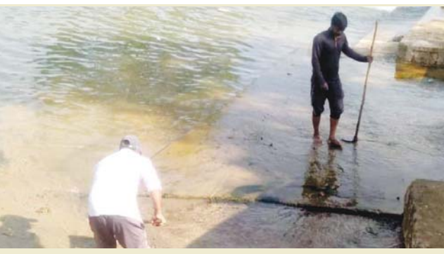
खरना का महत्व

छठ के महापर्व की शुरुआत 28 अक्टूबर से हो गई है। छठ का पहला दिन नहाय खाय होता है। छठ के व्रत को सबसे कठिन व्रत माना जाता है। मान्यता है कि जो महिलाएं छठ के नियमों का पालन करती हैं, छठी माता उनकी हर मनोकामना पूरी करती हैं। छठ पूजा में सूर्य देव का पूजन किया जाता है। यह पर्व चार दिनों तक चलता है। छठ पर्व का दूसरा दिन खरना कहलाता है। खरना का अर्थ होता है शुद्धिकरण। खरना के दिन छठ पूजा का प्रसाद बनाने की परंपरा है। शहर में छठ पर्व पर व्यवसाय भी अच्छा होता है।