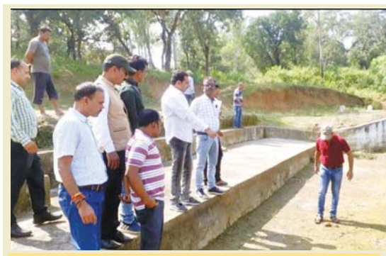
महापर्व की कल शाम से हुई शुरुआत

महापर्व छठ की शुरुआत महाभारत काल में हुई थी। इस पूजा की शुरुआत सूर्य पुत्र कर्ण के द्वारा हुई थी। कर्ण ने सूर्य देव की पूजा की। कथाओं के अनुसार कर्ण भगवान सूर्य के परम भक्त थे, वह हर दिन घंटों तक कमर जकितने पानी में खड़े होकर सूर्य को अर्घ्य दिया करते थे। उनके महान योद्धा बनने के पीछे सूर्य की कृपा थी। एक पौराणिक लोक कथा के अनुसार जब भगवान श्रीराम लंका पर विजय प्राप्त कर लौटे तो राम राज्य की स्थापना की जा रही थी। कार्तिक शुक्ल षष्ठी के दिन ही राम राज्य की स्थापना हो रही थी, उस दिन भगवान राम और माता सीता ने उपवास किया और सूर्य देव की आराधना की थी।