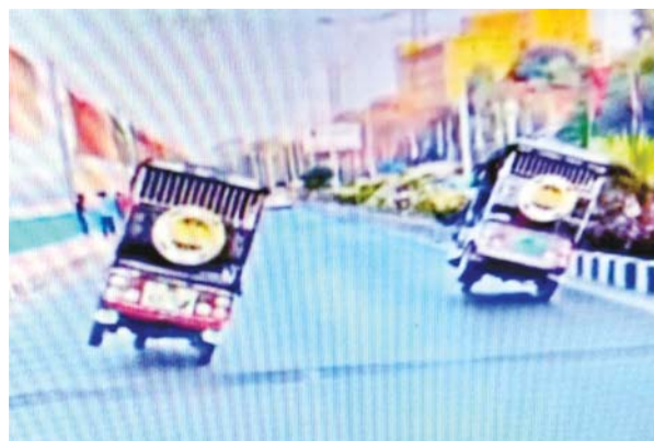
है कि बीच सड़क पर आटो चालकों द्वारा किए जा रहे इस स्टंट के दौरान यहां से दूसरे वाहन भी गुजर रहे हैं। ऐसे में हादसा भी हो सकता था। आटो चालकों द्वारा यह स्टंट कब किया गया, फिलहाल इसका पता नहीं चल पाया है। गौरिलब है कि वीआइपी

भोपाल, यशभारत। इंटरनेट मीडिया के बढ़ते चलन के इस दौर में स्टंटबाज युवा दूसरों का ध्यान आकर्षित करने के लिए तरह-तरह के करतब दिखाते हुए इनका वीडियो रिकार्ड कर वायरल करते रहते हैं। ऐसा ही एक वीडियो हाल में इंटरनेट मीडिया पर वायरल हुआ है, जिसमें राजधानी के वीआइपी रोड पर दो सवारी आइ चालक स्टंट करते नजर आ रहे हैं। ये आटो देखने में लाइटवेट बैटरी वाले लग रहे हैं, जिनमें दोनों चालक स्टंट की जुगलबंदी दिखाते हुए आटो को एक ओर झुकाते हुए तीन के बजाय दो पहियों पर दौड़ा रहे हैं। इसी दौरान पीछे से आ रहे एक वाहन चालक ने इनका यह स्टंट मोबाइल पर रिकार्ड कर लिया, जो अब इंटरनेट मीडिया पर वायरल हो रहा है। वीडियो में साफ नजर आ रहा