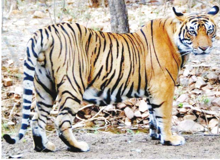
वन विहार नेशनल पार्क का होना और दूसरी आसपास बाघ का बसेरा। भोपाल के कलियासोत, केरवा, समर्था, अमोनी और

भोपाल, ईएमएस। मध्य प्रदेश की राजधानी भोपाल भारत की एकमात्र राजधानी है जहां के शहरी सीमा क्षेत्र में 12 से ज्यादा बाघ पनाहगार हैं। भोपाल की पहचान जहां टाइगर स्टेट से की जाती है, तो अब भोपाल की पहचान टाइगर कैपिटल के रूप में बनती जा रही है। भोपाल को बाघों ने ना सिर्फ अपना घर बनाया है, बल्कि यह प्रजनन के लिए भी बाघों का पसंदीदा स्थान बन गया है। दरअसल भोपाल के आसपास एक ही टैरिटरी में एक से अधिक बाघों का मूवमेंट है, लेकिन बाघ ज्यादा होने से यहां टैरिटोरियल फाइट नहीं होती है। यहां की पहचान अभी तक झीलों के शहर के नाम पर तो है ही, लेकिन अब इसकी पहचान टाइगर कैपिटल के रूप में बनती जा रही है। देश भर के शहरी इलाके में भोपाल से ज्यादा बाघ कहीं नहीं हैं। यहां के टाइगर की खासियत है कि वो इंसान के फेंड जैसे हो गए हैं। करीब 15 साल में एक भी जनहानि नहीं हुई। वहीं बाघों के मामले में भोपाल की 2 खास बातें हैं, पहली बीचो-बीच