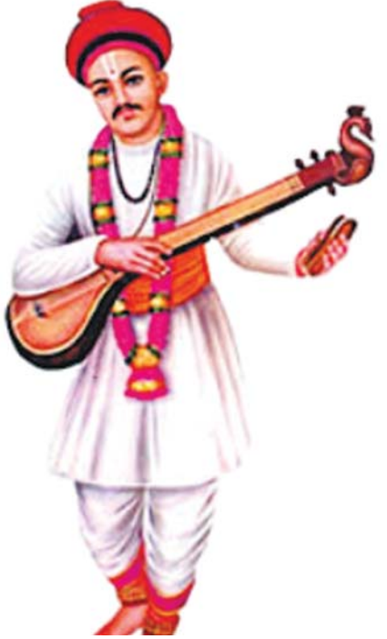
भारत की पावन धरती पर जब-जब धर्म की हानि और अधर्म की वृद्धि हुई है। तब-तब कोई न कोई महान संत, मनीषी अथवा स्वयं भगवान