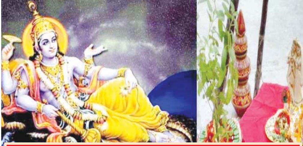
देवउठनी एकादशी 2022 पूजा मुहूर्त

कटनी, यशभारत। हिंदू कैलेंडर के अनुसार, कार्तिक माह के शुक्ल पक्ष की एकादशी तिथि देवउठनी एकादशी के नाम से प्रसिद्ध है। इसे प्रबोधिनी एकादशी या देवुत्थान एकादशी भी कहते हैं। इस दिन चातुर्मास का समापन होता है क्योंकि इस तिथि को भगवान श्रीहरि विष्णु चार माह के योग निद्रा से बाहर आते हैं। चातुर्मास के समापन पर भगवान विष्णु फिर से सृष्टि के संचालन का दायित्व लेते हैं। इस दिन भगवान विष्णु की पूजा करने और व्रत रखने का विधान है। देवउठनी एकादशी से मांगलिक कार्य प्रारंभ हो जाते हैं। काशी के ज्योतिषाचार्य बताते हैं कि देवउठनी एकादशी व्रत कब है और पूजा एवं पारण का समय क्या है।