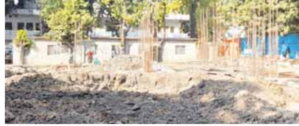
वाहन पार्किंग का बेहतर विकल्प मिल जाएगा। इसी परिसर में लगभग सौ खिलाड़ियों के लिए हॉस्टल का भी निर्माण किया जाएगा। पार्किंग स्थल के

जबलपुर . राइट टाउन स्टेडियम में सुबह-शाम बड़ी संख्या में एथलीट आते हैं। उनके वाहनों को खड़ा करने के लिए कोई जगह नहीं है। हालत यह है कि ज्यादातर वाहन सड़क पर खड़े रहते हैं। इसी तरह से स्टेडियम बाजार से लेकर मानस भवन के आसपास के दुकानदारों के सामने भी वाहन पार्किंग की समस्या है। आरसीसी स्ट्रक्चर पर पार्किंग विकसित हो जाने पर क्षेत्र के लोगों को