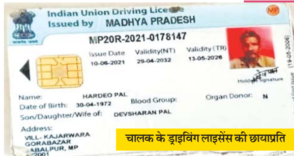
चालक के ड्राइविंग लाइसेंस की छायाप्रति