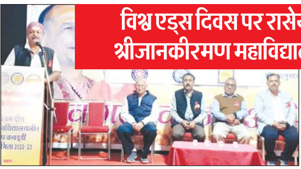
विश्व एड्स दिवस पर रासेयो जिला जबलपुर एवं रेड रिबन क्लब श्रीजानकीरमण महाविद्यालय के संयुक्त तत्वावधान में आयोजन