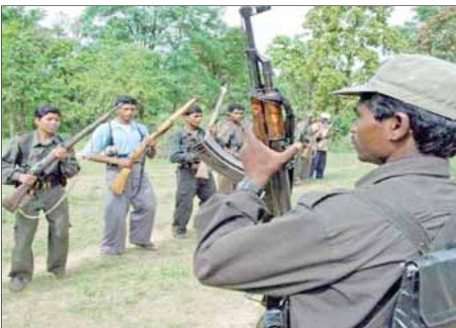
रवैया अपनाने पर सहमत बनी।

भोपाल, ईएमएस। छत्तीसगढ़ और महाराष्ट्र में नक्सलियों के खिलाफ चल रही ताबड़तोड़ कार्रवाई के बीच मप्र पुलिस ने भी महज 5 महीने में पांच बड़े स्तर के नक्सलियों को मार गिराया है। ऐसा पहली बार हुआ है कि इतने कम समय में दो डिविजन कमेटी मेंबर स्तर के भी नक्सलियों का भी एनकाउंटर हुआ हो। मप्र पुलिस के इस आक्रामक रवैए की तीन बड़ी वजह हैं। कान्हा में नक्सलियों के बढ़ते मूवमेंट का इनपुट दिल्ली से मिला था। इसके बाद तीन स्तर पर प्लानिंग की गई।