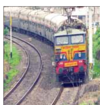
सोमवार को निरस्त रहेगी ट्रेन 11127 भुसावल-कटनी ट्रेन भुसावल से रविवार को निरस्त रही, सोमवार भी रहेगी ट्रेन नं. 11128 कटनी-भुसावल ट्रेन कटनी से सोमवार एवं मंगलवार को निरस्त रहेगी। इनका रूट डायवर्ट

भोपाल, यशभारत। मध्य रेलवे के भुसावल डिवीजन के जलगांव-भुसावल टिक पर तोसरी और चौथी रेल लाइन का काम किया जा रहा है। इसके लिए जलगांव स्टेशन पर प्री नॉन और नॉन इंटरलॉकिंग की जाएगी। इसका असर पश्चिम मध्य रेलवे ट्रेनों पर भी पड़ेगा। इसके लिए रेलवे ने ट्रेनों को निरस्त करने और रूस ट्रेनों का रूट डायवर्ट करने का निर्णय लिया है। इनमें से सात ट्रेनें भोपाल होती हुई जाएंगी। रेलवे ने इन ट्रेनें को किया निरस्त ट्रेन नं. 02132 जबलपुर-पुणे स्पेशल ट्रेन रविवार को निरस्त की गई ट्रेन नं. 02131 पुणे-जबलपुर स्पेशल ट्रेन सोमवार को पुणे से निरस्त रहेगी ट्रेन नं. 22937 रीवा-राजकोट ट्रेन रविवार को रीवा से निरस्त रही ट्रेन नं. 22938 राजकोट-रीवा ट्रेन राजकोट से