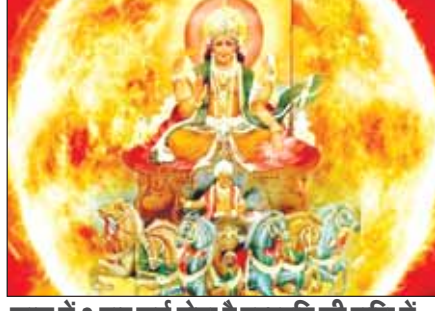
साल में 2 बार सूर्य होता है बृहस्पति की राशि में