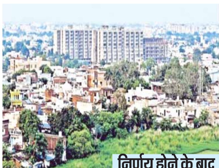
एकड़ क्षेत्र पर प्लॉन तैयार करने के लिए कहा है।

जबलपुर, यशभारत। स्मार्ट सिटी जबलपुर को इंडियन ग्रीन बिल्डिंग काउंसिल (आईजीबीसी) की तरफ से ग्रीन सिटी बनाने का प्रस्ताव आया था, जिसका अप्रूवल आज तक नहीं मिल पाया। मेंगलुरु और बेंगलुरु की स्मार्ट सिटी की तर्ज पर जबलपुर को भी विकसित करने की अवधारणा बनाई गई थी। जबलपुर में स्मार्ट सिटी की बोर्ड ऑफ डायरेक्टर की बैठक में निर्णय भी ले लिया गया कि जबलपुर को ग्रीन सिटी के रूप में विकसित किया जाएगा। इसके लिए आईजीबीसी से एमओयू हस्ताक्षर करके काम करने की पूरी तैयारी भी कर ली गई थी।