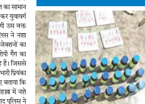
56 नग नशीले इंजेक्शन जब्त किए गए। जिनकी अनुमानित कीमत हजारों में है।