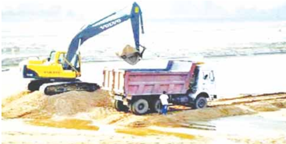
झांसीघाट से रेत भरकर आते हैं हाईवा

जबलपुर, यशभारत। रेत की कालाबाजारी रुकने का नाम नहीं ले रही है। प्रशासनिक स्तर पर तमाम प्रयासों के बाद भी रेत से भरे हाईवा बाईपास से पास हो रहे हैं। कालाबाजारी के चलते प्रशासन को लाखों की रायल्टी का रोज नुकसान हो रहा है। मेडिकल- भेड़ाघाट बायपास पर रेत से भरे हाईवा खड़े रहते हैं और सप्टाई की जा रही है। निर्माण कार्यों में रेत की बढ़ती उपयोगिता को देखते हुये जमकर दलाली भी होने लगी है। ट्रैक्टर से शुरु हुआ रेत दुलाई का सफर डम्पर और हाईवा तक जा पहुंचा है। पता चला है कि रेत की कालाबाजारी करने वालों ने सैकड़ों की संख्या में डम्पर / हाईवा चला रखे हैं, इनमें से अधिकांश में नंबर तक नहीं है। जबकि पूर्व में रेत की कालाबाजारी को रोकने के लिये प्रशासन ने सख्त कार्रवाई भी की थी। मगर कुछ दिनों तक कालाबाजारी बंद रहने के बाद फिर से सक्रिय हो गये हैं। सूत्रों के मुताबिक कार्रवाई में शिथिलता आते ही अवैध रूप से रेत निकालने और परिवहन का काम शुरू कर दिया गया है।