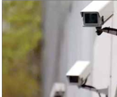
एक वर्ष यदि किसी शिक्षक की ड्यूटी किसी महाविद्यालय में लगाई

भोपाल, यशभारत। कॉलेज में एग्जाम के दौरान नकल रोकने के लिए अब सख्ती की जाएगी। मध्यप्रदेश के उच्च शिक्षा मंत्री ने एग्जाम को लेकर नए निर्देश दिए हैं। मध्यप्रदेश के विश्वविद्यालयों और महाविद्यालयों में होने वाली परीक्षाओं पर तीसरी आंख यानी सीसीटीवी कैमरे की नजर रहेगी।