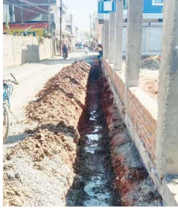
राम मनोहर लोहिया वार्ड नदीपार में किए जा रहे अवैध कब्जे की तस्वीर।