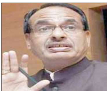
बैठक का एजेंडा तय नहीं हुआ है।

भोपाल, यशभारत। मुख्यमंत्री शिवराज सिंह चौहान ने रविवार को सभी मंत्रियों को भोपाल में बुलाया है। विकास यात्रा के बीच सभी मंत्री राजधानी में 12 घंटे रहेंगे। अचानक बैठक बुलाने से सियासी गलियारों में मंत्रिपरिषद विस्तार की अटकलें भी लग रही हैं। सीएम ने 19 जनवरी रविवार को सभी मंत्रियों को भोपाल में सुबह 9 से रात 9 बजे तक रहने को कहा है।