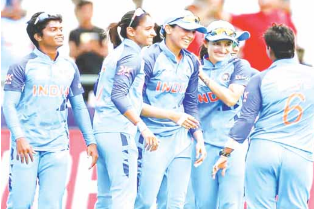
रिचा-हरमन ने पलटा मैच

वेस्टइंडीज ने भारत को 119 रन का टारगेट दिया था। लक्ष्य का पीछा करने में भारत ने पावरप्ले के 2 ओवरों में ही 28 रन बना दिए। लेकिन, तीसरे ओवर के बाद टीम इंडिया विखर गई। टीम ने चौथे ओवर में मंधाना के रूप में पहला विकेट गंवाया। अगले ही ओवर में जेमिमा रोड्रिग्स एक रन बनाकर आउट हो गईं। पावरप्ले के 6 ओवर में टीम का स्कोर 41 रन पर 2 विकेट था। इसके बाद भी अगले 2 ओवरों में 3 रन ही बनाए और शेफाली वर्मा का अहम विकेट गंवा दिया। शेफाली 28 रन बनाकर आउट हुईं और 8 ओवर के बाद टीम का स्कोर 3 विकेट पर 44 रन हो गया। इस तरह भारतीय टीम शुरुआती 2 ओवर के बाद 6 ओवरों में 16 रन ही बना सकी और टीम ने 3 विकेट भी गंवा दिए।