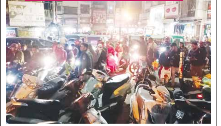
शहर के हृदयस्थल सुभाष चौक में कल रात घंटों जाम की स्थिति बनी रही। यहां सड़क तक लगी दुकानों और अस्त-व्यस्त पार्किंग की वजह से हर दिन इस तरह की स्थिति बन रही है। जाम की वजह से लोग परेशान होते नजर आए।