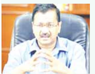
किसानों बेरोजगारों और आम जनता की समस्याओं को हल करना हमारी प्राथमिकता