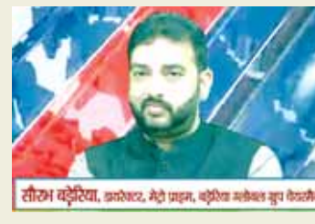
सीरिज बड़ेरिया, कलेक्टर, मेडो प्रजन, कृषि विभाग, कृषि विभाग

भारत द्वारा शिक्षा व स्वास्थ्य के क्षेत्र में काम कर रहे लोगों से चर्चा की और बजट