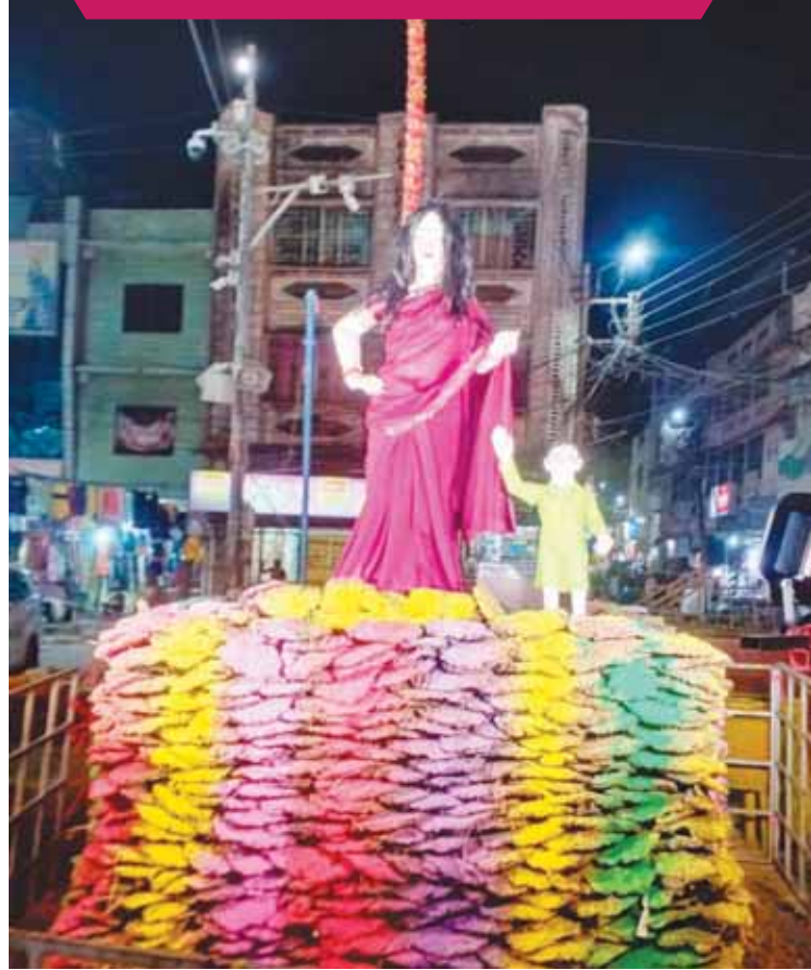
सुभाष चौक में स्थापित भक्त प्रह्लाद व होलिका की प्रतिमा आकर्षण का केंद्र बनी हुई है।