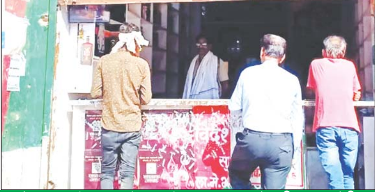
होटल-ढाबे बन गये अहाते, सड़क पर हो रही दारुखोरी

जबलपुर, यशभारत। तय सीमा के बाहर शराब दुकान खोलना आबकारी अधिनियम के तहत गलत है इसी वजह से हाल ही में आबकारी विभाग ने शहर में तीन शराब ठेकेदारों को नोटिस देते हुये दुकानें सील कर दीं। लेकिन आबकारी अधिनियम में यह भी प्रावधान है कि जिस क्षेत्र में स्थानीय जन शराब दुकान खोलने का विरोध करते हैं तो वहां भी शराब दुकानें नहीं खोली जा सकती लेकिन अफसोस की बात है कि शहर में कई जगह क्षेत्रिय लोग अपने क्षेत्र में शराब दुकान खोले जाने का विरोध कर रहे हैं लेकिन उनकी न तो आबकारी विभाग सुन रहा है ना ही जिला प्रशासन। और तो और चेरिताल में तो शराब दुकान का विरोध कर रहे लोगों पर पुलिस ने लाठीचार्ज कर उनको खदेड़ और अपनी सुरक्षा में शराब दुकान खुलवा दी। अब ऐसे शराब ठेकेदार का दबदबा नहीं तो और क्या कहा जायेगा। कायदे से जब क्षेत्र की महिलायें यंहा शराब दुकान खुलने का विरोध कर रही थी तो आबकारी विभाग ने क्यों दुकान नहीं और शिफ्ट नहीं की। इसके अलावा पुलिस ने किस दबाव या फायदे के कारण धरना दे रही महिलाओं पर बलपूर्वक कार्यवाही की।