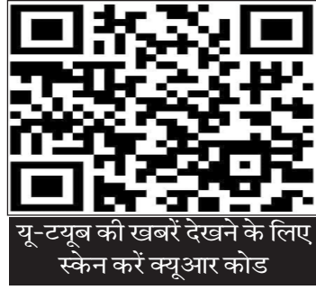
यू-ट्यूब की खबरें देखने के लिए स्कैन करें क्यूआर कोड