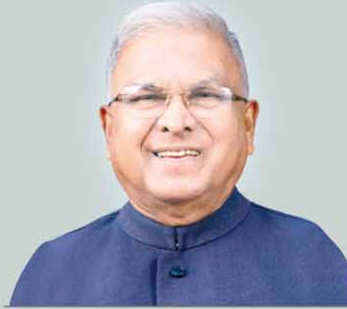
मंगुभाई पटेल, राज्यपाल