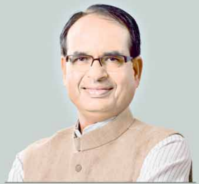
शिवराज सिंह चौहान, मुख्यमंत्री

विगत तीन वर्षों में अनुसूचित जाति के 55 लाख 73 हजार से अधिक हितग्राहियों को ₹ 2600 करोड़ की सहायता से लाभान्वित किया गया है।