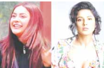
जिसका कोई नहीं उसका भगवान है- शहनाज

नई दिल्ली, एजेंसी। शहनाज गिल इन दिनों अपनी डेब्यू हिंदी फिल्म 'किसी का भाई किसी की जान' को लेकर सुर्खियों में हैं, आए दिन फिल्म से या एक्ट्रेस से जुड़ी बातें सामने आती रहती हैं। हालांकि शहनाज आज जिस मुकाम पर हैं उन्हें कहां तक पहुंचाने के लिए बहुत साल लगे हैं और शहनाज गिल कई बार अपने स्ट्रगल के बारे में बता चुकी हैं। वहीं अब पंजाब की कैटरीना शहनाज गिल ने बताया कि कैसे जब उन्होंने अपना काम शुरू किया था तो पंजाब फिल्म इंडस्ट्री से उन्हें बहुत जलालत श्रेलने पड़ी थी और अब एक्ट्रेस ने बताया कि एक बार तो उन्हें उनकी ही एक फिल्म के प्रीमियर बाहर का रास्ता दिखा दिया गया था।