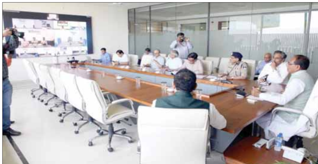
सीएम शिवराज ने अधिकारियों से कहा कि इंटरनेट मीडिया पर नजर रखें। भ्रामक खबरें, संवेदनहीन, कटुता बढ़ाने वाले कमेंट लिखने वालों को पहचानें और आवश्यक

भोपाल, यशभारत। प्रदेश शासन अब ऐसे संस्थानों पर शिकंजा कसने जा रहा है, जहां बच्चों को शिक्षा के नाम पर कटुता का पाठ पढ़ाया जाता है। अवैध मदरसों के समेत ऐसे संस्थानों का अब रिव्यू किया जाएगा। इसके अलावा इंटरनेट मीडिया पर भ्रामक खबरें, संवेदनहीन, कटुता बढ़ाने वाले कमेंट लिखने वालों के खिलाफ भी कार्रवाई की जाएगी। सीएम शिवराज ने आज अपने आवास पर कानून-व्यवस्था की समीक्षा बैठक में अधिकारियों को इस आशय के निर्देश दिए। सीएम शिवराज ने स्पष्ट कहा कि प्रदेश में कटुता और अतिवाद को बर्दाश्त नहीं किया जाएगा।