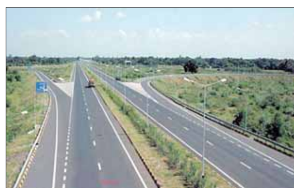
वाहनों का आवागमन बहुतायत में होता है। शहर के सुनियोजित विकास एवं आर्थिक गतिविधियों को विस्तार देने के लिए नए बायपास की आवश्यकता है। यह नया बायपास इंदौर शहर को पश्चिम-दक्षिण में अहमदाबाद-नागपुर राष्ट्रीय राजमार्ग 47 एवं पूर्व-उत्तर में

इंदौर के यातायात को व्यवस्थित रूप देने के लिए शिवराज सरकार 139 किलोमीटर का रिंग रोड बनाने की तैयारी में है। इसके लिए मुख्यमंत्री शिवराज सिंह चौहान ने केंद्रीय सड़क परिवहन एवं राजमार्ग मंत्री नितिन गडकरी को प्रस्ताव दिया है। इस रिंग रोड के बनने से इंदौर से लगे छह जिलों के आर्थिक विकास को नई दिशा मिलेगी। इस मार्ग के निर्माण की प्रस्तावित लागत तीन हजार 125 करोड़ रुपये है। राज्य सरकार 25 प्रतिशत राशि भारत माला चैलेंज मोड योजना में देने के लिए तैयार है। मुख्यमंत्री द्वारा दिए गए प्रस्ताव के अनुसार शहरी विस्तार के कारण इंदौर का मौजूदा बायपास शहर की भीतरी सीमा में आ गया है, जिस पर स्थानीय