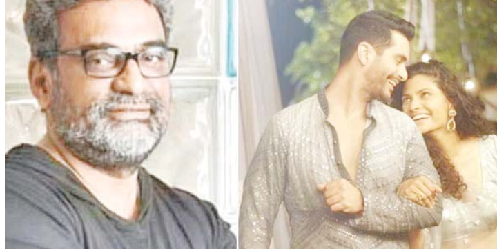
थिलर फिल्म थी। फिल्म की कहानी को समीक्षकों को केंद्र में रखकर बनाया गया है। फिल्म समीक्षक को चुप कराने निकले एक जुनूनी शख्स का मानना है कि उसकी समीक्षा कैसे एक फिल्मकार की दिशा और दशा को बदल देती है। आर बाल्की के निर्देशन में बनी यह फिल्म हिंदी सिनेमा के कालजयी

मुंबई, एजेंसी। लेखक-निर्देशक आर बाल्की की पहचान हिंदी सिनेमा में लोक से इतर फिल्मों को लेकर रही है। बच्चन परिवार के वह खास निर्देशक हैं और उनकी हर फिल्म का इस परिवार से कोई न कोई रिश्ता जरूर रहा है। अपनी पिछली फिल्म 'चुप-रिवेंज ऑफ द आर्टिस्ट' में दर्शकों को आकर्षित करने में पूरी तरह विफल रहे बाल्की अब एक ऐसी कहानी लेकर आ रहे हैं जो दुष्टता में घायल एक महिला क्रिकेट खिलाड़ी के जीवत की कहानी कहती है। फिल्म में सैयामी खेर और अभिषेक बच्चन की मुख्य भूमिकाएं हैं। सैयामी की दादी के किरदार में फिल्म में शबाना आजमी तो होंगी ही, सूत्र बताते हैं कि अमिताभ बच्चन भी फिल्म में एक स्पेशल अपीयरेंस में नजर आने वाले हैं। 18 अगस्त को रिलीज होने जा रही फिल्म 'सूत्र' से पहले आइए डालते हैं आर बाल्की के निर्देशन में बनी फिल्मों के रिपोर्ट कार्ड पर एक नजर.