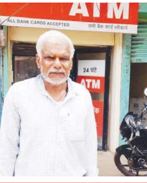
बदमाशों की सुरक्षित शरण स्थली बना बरही

कटनी/बरही, यशभारत। आइए लूट ले जाइए, धोखाधड़ी करिए, इन्मीनन से रहिए, आपका कुछ भी नहीं होगा, कोई नहीं कभी नहीं पकड़े जायेंगे, खूब लूटिए, छिनकर भाग जाइए, आप सुरक्षित है। जी हां कटनी जिले के बरही नगर में बेखौफ हो रही चोरी, लूट, धोखाधड़ी की वारदातों व पुलिस के रवैये से शायद बदमाशों को यही संदेश दिया जा रहा है कि बदमाश व बदमाशी करने वाले यहां सुरक्षित रहेंगे। इस बार एटीएम में धोखाधड़ी का शिकार रिटायर्ड डिप्टी रेंजर हुआ है। गत 25