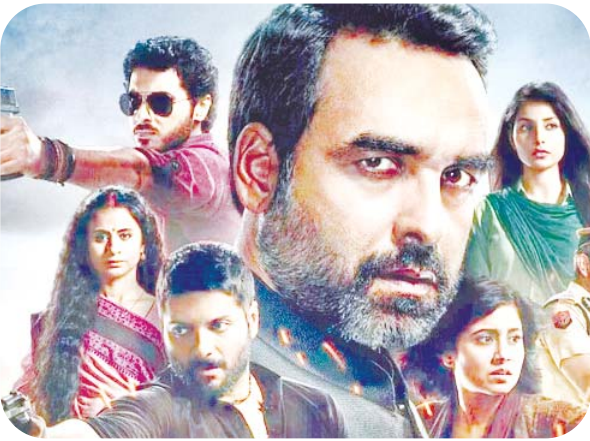
मिर्जापुर की दुनिया ने दर्शकों को आकर्षित किया है। सीरीज के तीसरे सीजन पर काम जारी है। वहीं, निर्माताओं ने इस दौरान इस पर एक फिल्म बनाने का काम शुरू किया है, और वे एक ऐसा विचार विकसित कर रहे हैं, जो दर्शकों का मनोरंजन करेगा। एक बार जब यह तय हो जाएगा, तो वे लॉजिस्टिक्स में लग जाएंगे। हालांकि, यह निश्चित है कि वे मिर्जापुर को एक फिल्म के रूप में भी प्रस्तुत करना चाहते हैं। मिर्जापुर फिल्म की क्या होगी कहानी? मिर्जापुर के पहले सीजन में विक्रान्त मैसी और श्रिया पिलगांवकर भी लीड रोल में थे, जिसका प्रीमियर नवंबर 2018 में हुआ। दूसरा सीजन अक्टूबर 2020 में विजय वर्मा

मुंबई, ईएमएस। ओटीटी स्पेस की सफल वेब सीरीज मिर्जापुर के तीसरे पार्ट मिर्जापुर 3 का फैस को बेसब्री से इंतजार है। वहीं, अब मेकर्स मिर्जापुर पर फीचर फिल्म बनाने की योजना कर रहे हैं। ओटीटी स्पेस की सबसे सफल और चर्चित वेब सीरीज में से एक मिर्जापुर के तीसरे सीजन को लेकर फैस काफी उत्साहित हैं। पंकज त्रिपाठी, रसिका दुग्गल, दिव्येंद्र शर्मा, कुलभूषण खरबंदा और अली फजल स्टार इस क्राइम ड्रामा को लेकर आदि निर्देशन को न कोई अपडेट सामने आ रहा है। वहीं, अब इसे लेकर एक बड़ी जानकारी आई है। प्राइम वीडियो के इस शो को निर्माता नया टिक्स्ट देने की योजना बना रहे हैं।