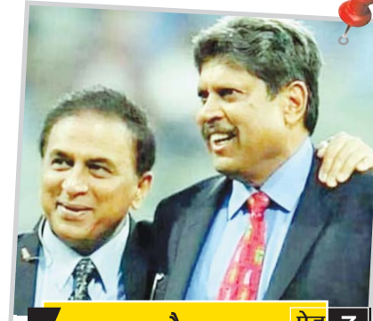
बहुत ज्यादा पैसा आ जाता... पेज 7

● वर्ष-17 अंक 179 ● कटनी ● सोमवार, 31 जुलाई, 2023 ● मूल्य-2 रुपए ● पृष्ठ-8 ● प्रथम श्रावण मास शुक्ल पक्ष 15 ● विक्रम संवत् 2080 शके 1935