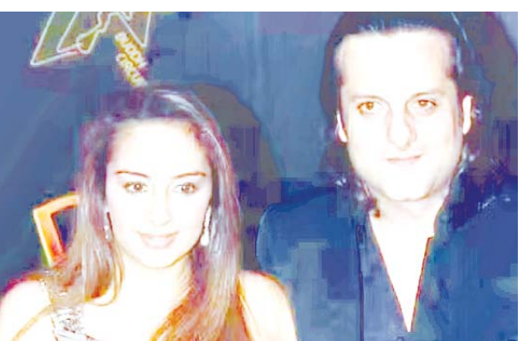
मुंबई में रह रहे हैं और नताशा इस समय अपने परिवार के साथ लंदन में हैं। फरदीन खान और नताशा माधवानी - बता दें कि साल 2005 में फरदीन खान और नताशा माधवानी की शादी काफी धूमधाम से हुई थी। 2013 में कपल ने अपने पहले बच्चे एक बेटी का स्वागत किया और 2017 में उनके यहां दूसरा बच्चा यानी बेटे ने जन्म लिया था।

मुंबई, एजेंसी। बॉलीवुड से सितारों की तलाक की खबरें आना आम बात हो चली है और इस लिस्ट में अब अभिनेता फरदीन खान का नाम भी जुड़ गया है। फरदीन खान और नताशा माधवानी - बॉलीवुड से सितारों की तलाक की खबरें आना आम बात हो चली है और इस लिस्ट में अब अभिनेता फरदीन खान का नाम भी जुड़ गया है। रिपोर्ट्स की मानें तो फरदीन खान और नताशा माधवानी की शादीशुदा जिंदगी में सबकुछ ठीक नहीं चल रहा है। चर्चा है कि कपल अलग होने की ओर बढ़ रहे हैं और उन्होंने तलाक लेने का फैसला किया है। जी हां, 18 साल की ये शादी अब खत्म होने वाली है लेकिन इसको लेकर किसी तरह का आधिकारिक एलान दोनों ने नहीं किया है। मीडिया रिपोर्ट्स के अनुसार दोनों काफी समय अलग हो रहे हैं। फरदीन खान अपनी मां के साथ