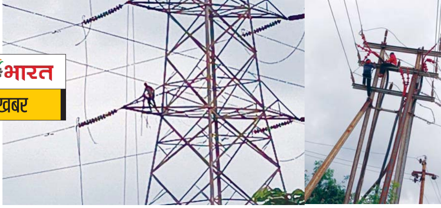
उमस और गर्मी से बुरा हाल रहा आधे शहर का

कटनी, यशभारत। एक तो वैसे ही बारिश के अभाव में शहर के लोगों का गर्मी और उमस से बुरा हाल है, इसके बाद यदि 10 घंटे बिजली आपूर्ति ठप रहेगी तो लोगों की परेशानियां बढ़ना स्वाभाविक है। रविवार का दिन हजारों शहरवासियों के लिए परेशानियों से भरा रहा। सुबह 6 बजे से लेकर शाम 4 बजे तक पहरूआ फीडर की विद्युत आपूर्ति बाधित रही। लोक निर्माण विभाग द्वारा मड़गवां रेल ओवर ब्रिज के ऊपर से गुजरी अति उच्च दाव विद्युत लाइनों के उन्मूलन कार्य हेतु रविवार 30 जुलाई को सुबह 6 बजे से दोपहर 12 बजे तक विद्युत आपूर्ति बंद रखने का परमिट लिया गया था लेकिन दोपहर 12 बजे की बजाय शाम 4 बजे तक विद्युत आपूर्ति ठप रही। जिससे लोगों को ख़ासी परेशानियों का सामना करना पड़ा।